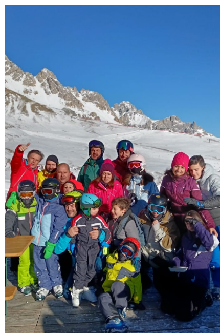
Istantanea dal Campo invernale...

Inizierà il 14 gennaio una catechesi sulla grandezza e la bellezza della Eucaristia. Ogni domenica, durante la celebrazione, si vivrà con particolare attenzione una parte della Messa (i riti iniziali e l'atto penitenziale, la Liturgia della Parola, l'offerta, la preghiera eucaristica, i riti di comunione). Sarà per tutti una occasione di conoscenza più profonda e di esperienza più viva dell'incontro che il Signore Risorto ci offre in ogni Eucaristia. Sul foglio parrocchiale, ogni settimana ci saranno testi di catechesi e approfondimento.